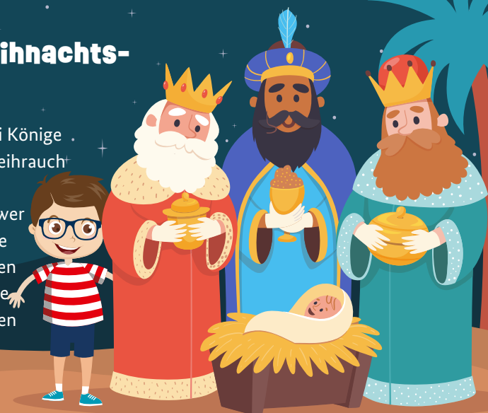
Auflösung: A Caspar, B Balthasar, C Melchior

Die Heiligen Drei Könige bringen Gold, Weihrauch und Myrrhe zum Jesuskind. Aber wer bringt was? Folge den verschiedenen Wegen und ordne die Geschenke den Königen zu.