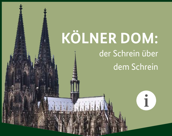
KÖLNER DOM: der Schrein über dem Schrein

Die Gebeine der drei Heiligen werden bereits 1157 in Mailand gefunden und 1164 nach Köln überführt. Dort entsteht in den folgenden Jahrzehnten bis 1220 der Dreikönigenschrein. Der Bedeutungszuwachs, den der Dom in Köln durch den Besitz der Reliquien erfährt, ist der entscheidende Anstoß zum Neubau der Bischofskirche. Ab 1248 wird die gigantische gotische Kathedrale als architektonischer Schrein über dem Schrein gebaut. Heute erhebt sich der Reliquienschrein hinter dem Hochaltar und bildet das Zentrum des Domes.